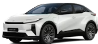
Platinum White Pearl / Attitude Black