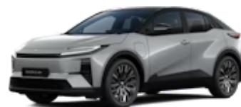
Mineral Me. / Attitude Black