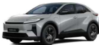
Manhattan Grey Me.