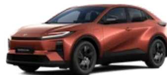
Metal Oxide Cs.