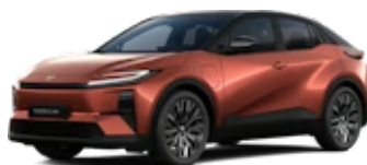
Metal Oxide / Attitude Black