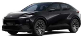
Attitude Black Mc.