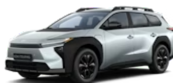
Ice Silver Metallic