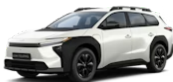
Crystal White Pearl