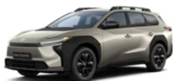
Brilliant Bronze Metallic