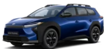
Sapphire Blue Pearl