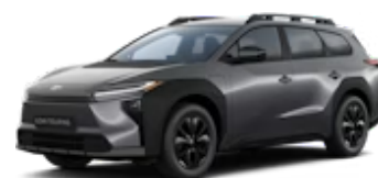
Magnetite Gray Metallic